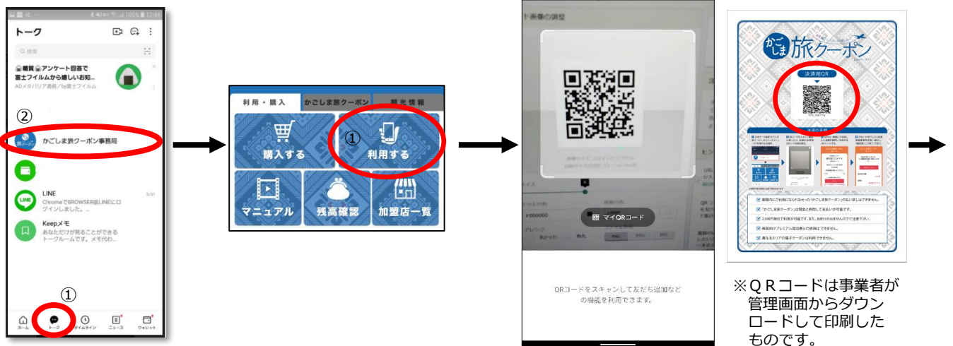
(1) LINEを起動し ①トーク画面から、 ②「かごしま旅クーポン事務局」を選択します。