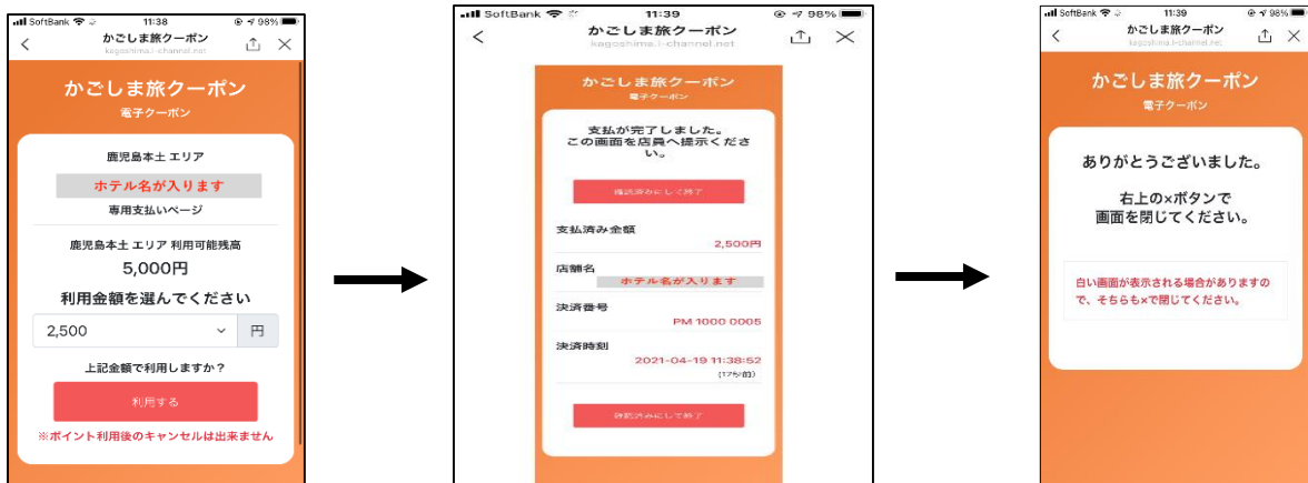
(4) QRコードを読み込むと金額選択画面に移行します。利用者側が金額を選択して「利用する」を押して下さい。